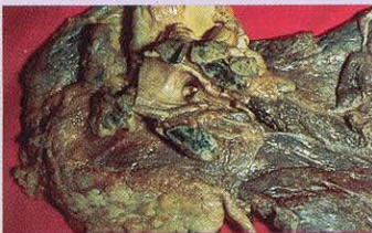
Phổi bị ung thư

Đ: Khói thuốc lá là nguyên nhân chính làm cho không khí bị ô nhiễm ở trong cơ quan. Dù chị ở xa người hút thuốc, nhưng nếu chị thường xuyên hít phải khói thuốc, thì làn làn sức khỏe của chị cũng bị ảnh hưởng.