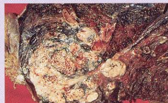
Phổi bị ung thư