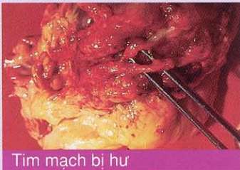
Tim mạch bị hư